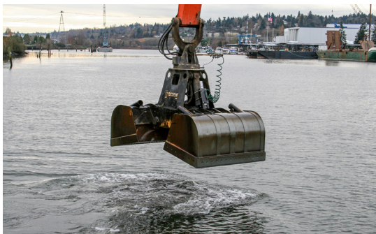
កូរ៉េស៊ីស្តបច្ចេកទេស KING COUNTY

ការសាងសង់នៅតំបន់ខាងលើផ្លូវទឹកនេះត្រូវបានគេរំពឹងថានឹងចាប់ផ្តើមនៅខែតុលានេះ ហើយនឹងធ្វើឡើងនៅក្នុងរដូវសាងសង់ (ខែតុលា - ខែកុម្ភៈ) ក្នុងរយៈពេលបីឆ្នាំខាងមុខ ហើយនឹងបញ្ចប់នៅខែ កុម្ភៈ ឆ្នាំ 2027។ សកម្មភាពសាងសង់ក្នុងទឹកត្រូវបានដាក់កម្រិតត្រឹមខែទាំងនេះប៉ុណ្ណោះ ដើម្បីកំណត់ផលប៉ះពាល់ដល់ប្រភេទត្រីមួយចំនួន។