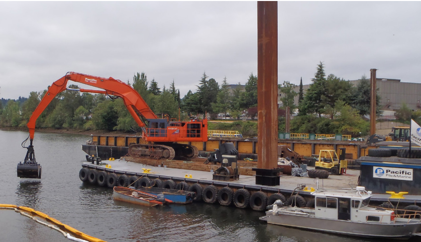
កុត្តរមើលរូបថត៖ ANCHOR QEA

គ្រឿងចក្រដឹកដីប្រភេទអ៊ីដ្រូលីកកាយយកដីល្បាប់កខ្វក់ចេញពីបាតទន្លេ។